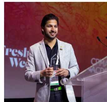
City Wide Produce